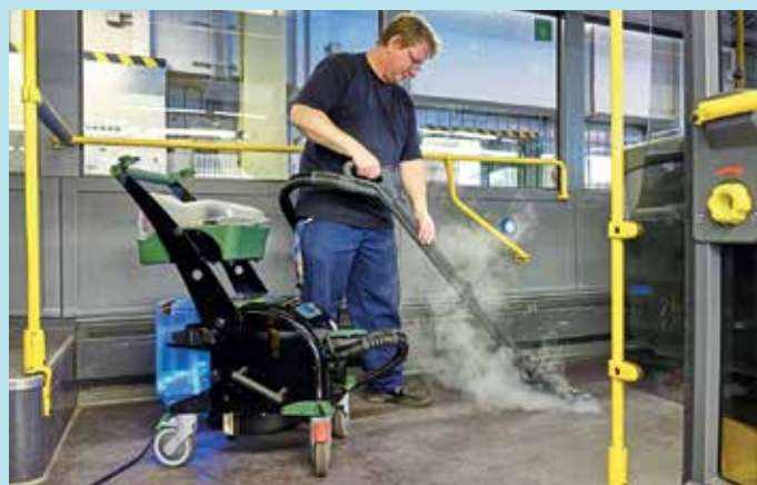
Da das System mit trockenem Dampf arbeitet, sind die gereinigten Flächen schnell wieder trocken.