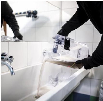
Bei Blue-Evolution landen die Schmutz- partikel im Wasserfilter.

Der Blue Evolution S+ und der Blue Evo- lution XL+ sind mit einem robusten Edel- stahl-Gehäuse und vier frei beweglichen Lenkrollen ausgestattet. Die Multifunkti- onsgeräte verfügen außerdem über ver- schiedene Aufsatzdüsen, und ihr Dampf- druck kann so reguliert werden, dass alle Oberflächen gründlich und schonend ge- säubert werden können. Weiterer Plus- punkt in der Praxis: Alle Modelle verfügen über ein zusätzliches Heißwassermodul für hartnäckigste Verschmutzungen. Als Besonderheit warten sie zudem mit einem Blau-licht-Effekt auf, bei dem Keime keine Chance haben. Denn die gelösten Schmutzpartikel landen im Wasserfilter und werden im Wasser gebunden. Die darin enthaltenen Keime werden dann über das UV-Blau-licht abgetötet.