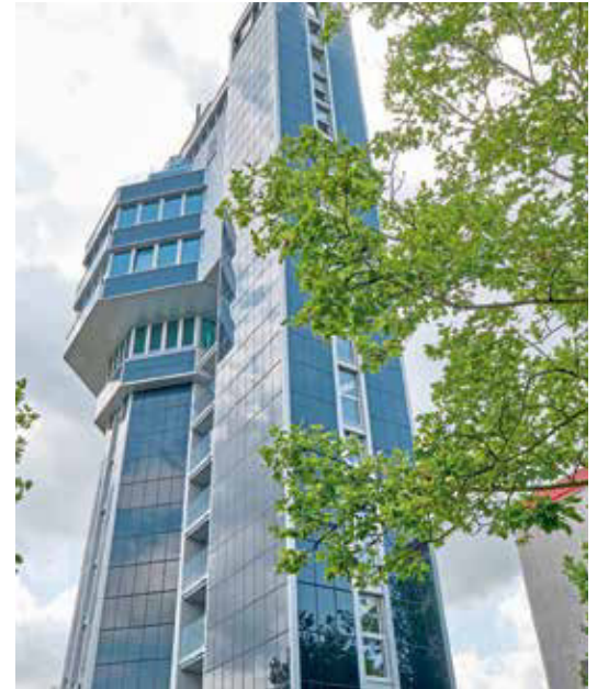
Das Aquatum Hotel ist ein Null-Energie-Hochhaus.

Beam / Das Aquatum Hotel in Radolfzell am Bodensee legt viel Wert auf Ökologie und Nachhaltigkeit. Das Null-Energie-Hochhaus wurde bereits mehrfach ausgezeichnet. Ziel war es, diese „grüne Linie“ auch beim House-keeping durchzuziehen. Deshalb setzt das