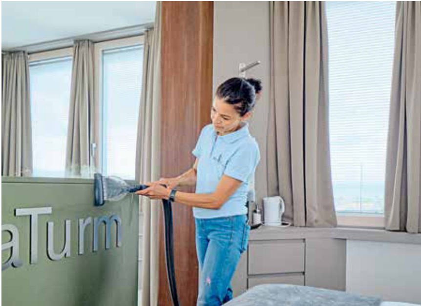
Die Multifunktionsgeräte für chemiefreie Reinigung arbeiten mit heißem Trockendampf.