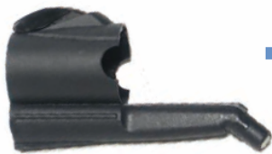
Punktstrahldüse Art.Nr.: 8012