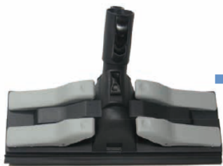
Rechteckbürste Art.Nr.: 8014

Wird am Handgriff oder mit Verlängerungsrohr eingesetzt